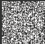
BDO Jordan Academy